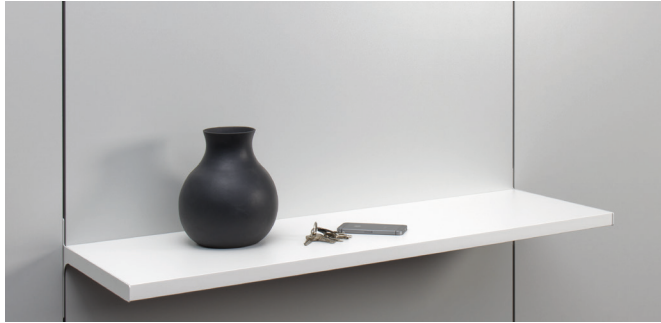
Einhänge-Regal mit Flachkonsole

Einhänge-Regal mit zwei Flachkonsolen und einem Regalboden 25 mm, kann mit Unterteilungsbügeln und Eihänge-Buchstütze bestückt werden