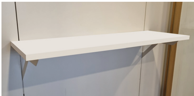
Ablageboden mit Schwerlastkonsole, Typ 2

Einhänge-Regal bestehend aus zwei Schrägkonsolen und einem Regalboden 25 mm