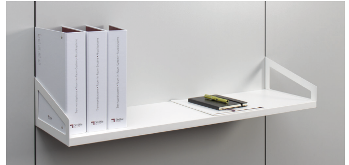
Einhänge-Regal mit Schrägkonsole

Einhänge-Regal mit zwei Flachkonsolen und einem Regalboden 25 mm, kann mit Unterteilungsbügeln und Eihänge-Buchstütze bestückt werden